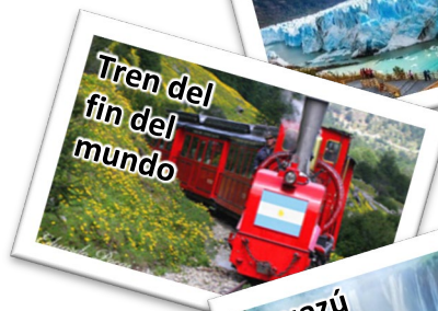
Tren del fin del mundo