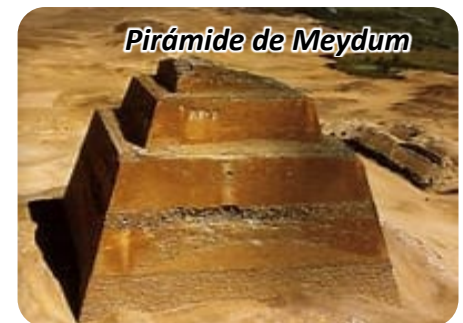
Pirámide de Meydum