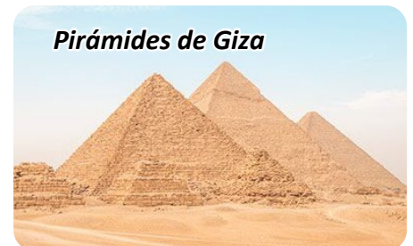
Pirámides de Giza