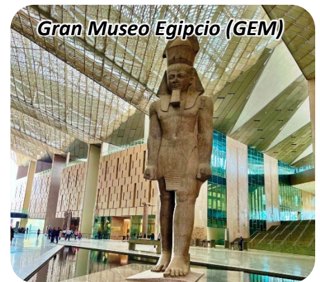
Gran Museo Egipcio (GEM)

Precio TOTAL p/p: $5,775.00 en ocupación doble o triple Mín. 30, Máx. 40 pasajeros