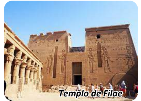
Templo de Filae