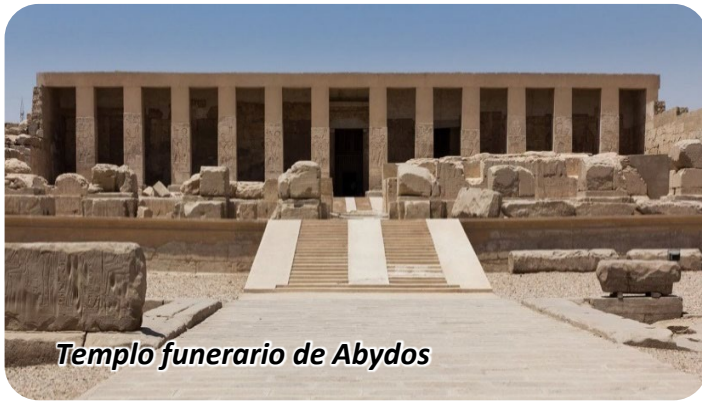
Templo funerario de Abydos