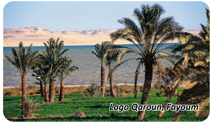
Lago Qaroun, Fayoum