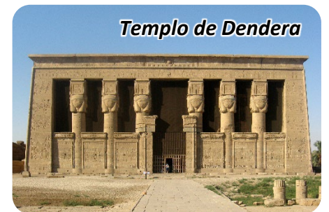
Templo de Dendera