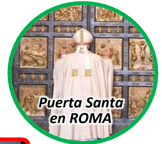
Puerta Santa en ROMA