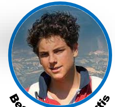
Beato Carlo Acutis