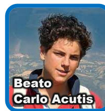
Beato Carlo Acutis