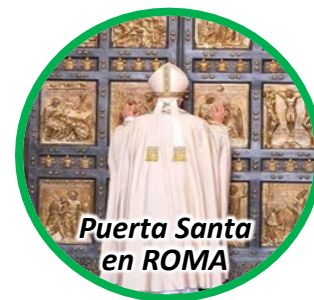
Puerta Santa en ROMA