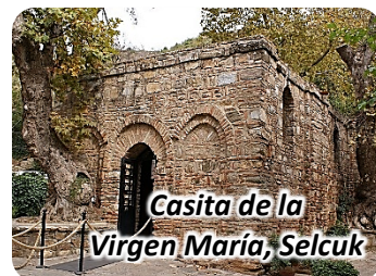
Casita de la Virgen María, Selcuk