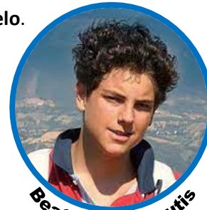
Beato Carlo Acutis