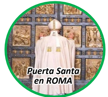
Puerta Santa en ROMA