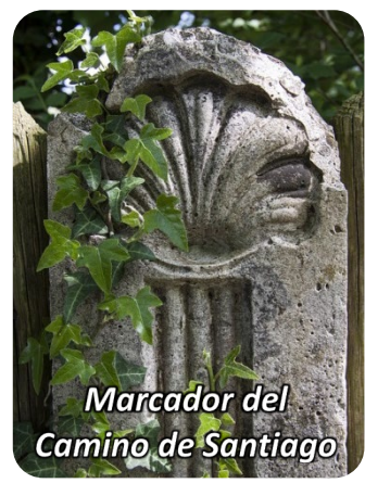
Marcador del Camino de Santiago