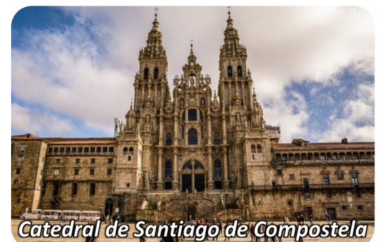
Catedral de Santiago de Compostela

Precio TOTAL p/p: $4,257.00 en doble o triple incluyendo impuestos y propinas Mínimo 30 pasajeros, máx. 35