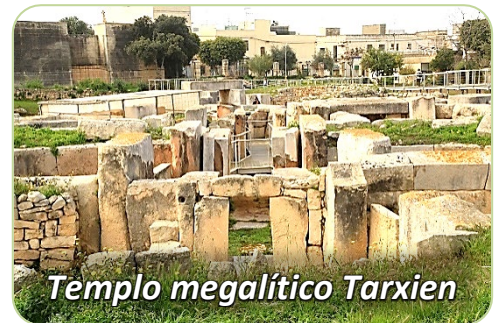
Templo megalítico Tarxien