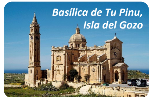
Basílica de Tu Pinu, Isla del Gozo