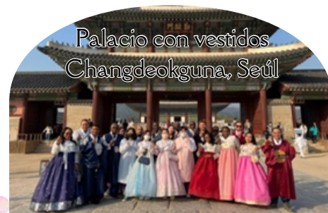
Palacio con vestidos Changdeokgung, Seúl