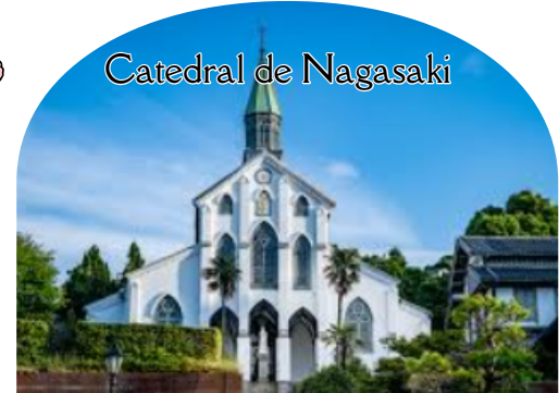
Catedral de Nagasaki