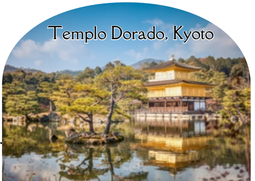
Templo Dorado, Kyoto