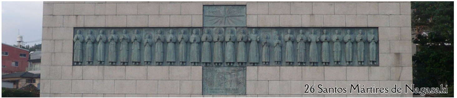
26 Santos Mártires de Nagasaki