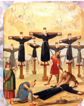
Mártires de Japón

Salida: domingo, 12 de abril 2026 Regreso: miércoles, 29 de abril 2026