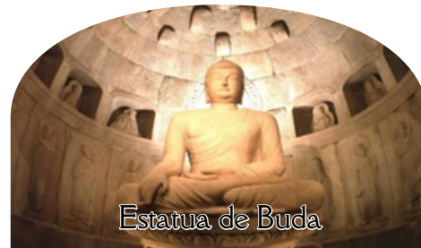
Estatua de Buda